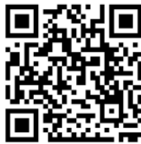
(QR Code หมายเลข 7)

ตามที่ สำนักงานเขตพื้นที่การศึกษามัธยมศึกษากรุงเทพมหานคร เขต 2 ได้ขอให้โรงเรียนดำเนินการ แต่งตั้งคณะกรรมการความปลอดภัยและเจ้าหน้าที่ดูแลระบบ MOE Safety Center ให้แล้วเสร็จนั้น จึงขอเน้นย้ำ และกำชับให้โรงเรียนดำเนินการตามแนวทางการบริหารจัดการระบบมาตรฐานความปลอดภัย (MOE Safety Center) พร้อมกำชับในเรื่องของช่องทางการแจ้งเหตุความปลอดภัยของสถานศึกษาผ่าน 4 ช่องทาง (ตาม QR Code หมายเลข 7)