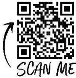
(QR Code หมายเลข 4)

การย้ายและแต่งตั้งข้าราชการครูและบุคลากรทางการศึกษา สายผู้บริหารสถานศึกษา สังกัด สพม.กท 2 ประจำปีงบประมาณ พ.ศ. 2565 โดยมีตำแหน่งที่ว่าง และที่คาดว่าจะว่าง (จากการเกษียณอายุราชการปีงบประมาณ พ.ศ.2565) (ตาม QR Code หมายเลข 4)