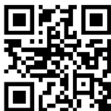
(QR Code หมายเลข 6)

อัตรากำลังข้าราชการครูและบุคลากรทางการศึกษา สังกัด สพม.กท 2