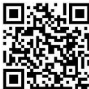
(QR Code หมายเลข 5)

หลักเกณฑ์การโอนเงินเดือนข้าราชการครูและบุคลากรทางการศึกษา/ลูกจ้างประจำ ครั้งที่ 2 (1 ตุลาคม 2565)