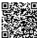
(QR Code หมายเลข 1)

ณ หอประชุมเอนกประสงค์ โรงเรียนเทพศิรินทร์ร่มเกล้า (ตาม QR Code หมายเลข 1)